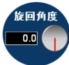
(アーム旋回角度表示)