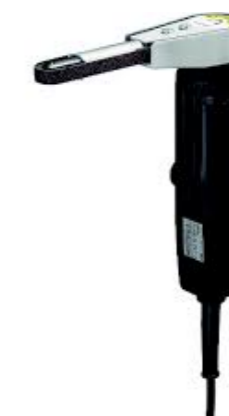
L-JB 定価: ¥31,200(税抜き) バリ取り、面取りにおすすめ