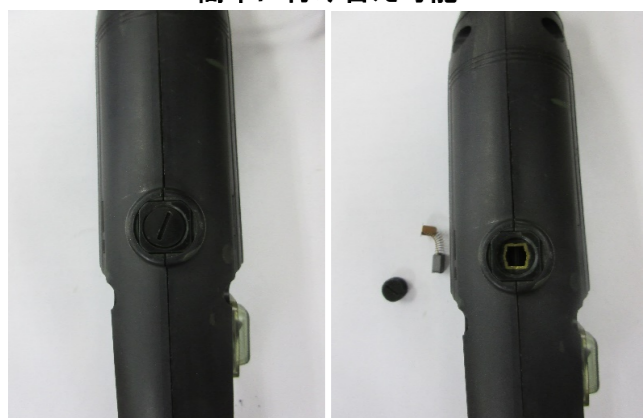
L-JK用 カーボンブラシ CB15(1pk4個入) 定価: ¥1,500(税抜き)