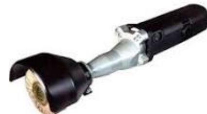
L-8 定価: ¥39,000(税別) フラップサンダーにおすすめ