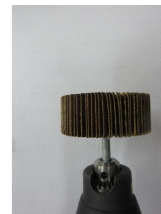
フラップサンダー ×