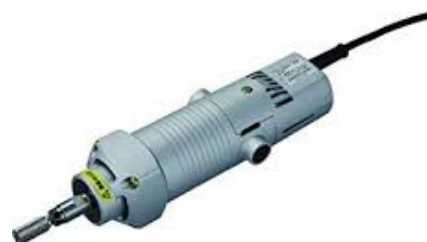
L-4TP 定価: ¥56,900(税別) 特に超硬カッターにおすすめ