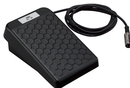
外形寸法 W110×D170×H65 コード 1.9m